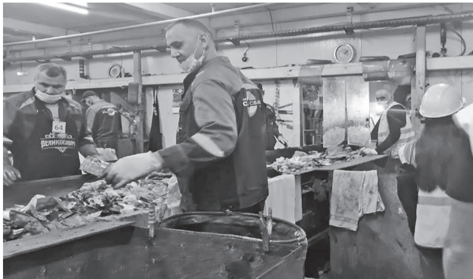
Люди, работающие на сортировке мусора, выполняют нелёгкое, но нужное дело.

На момент экскурсии на линии трудились 64 человека. Считаю этих людей героями, так как они выполняют нелёгкое и благородное дело. У работников сортировочной станции