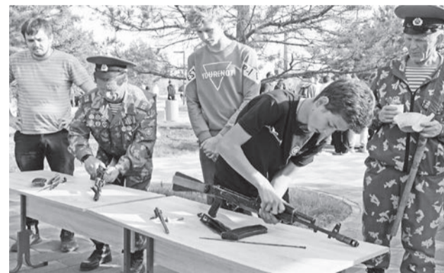
Были организованы соревнования в разных видах военно-прикладных единоборств.

Дмитрий Фонвизин говорил: «Имей душу, имей сердце и будешь человеком во всякое время». Чак Паланик писал, что «человечность измеряется тем, как мы ведём себя с животными». Но они не одни так думают... Так же думают и ученики 11б и 7а классов Байкаловской школы. А вообще... давайте по порядку.