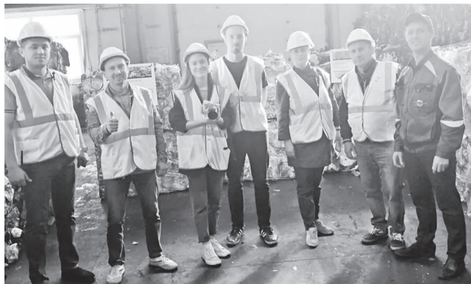
На экскурсии по мусоросортировочному заводу.