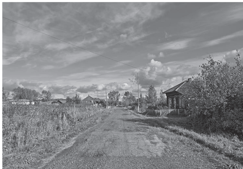
Улица Мамарина сегодня.