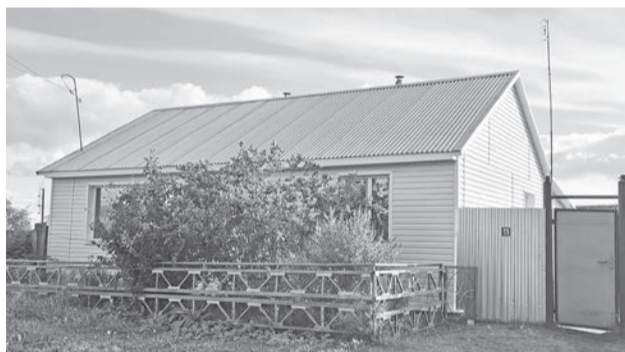
Улица Мамарина, 11.