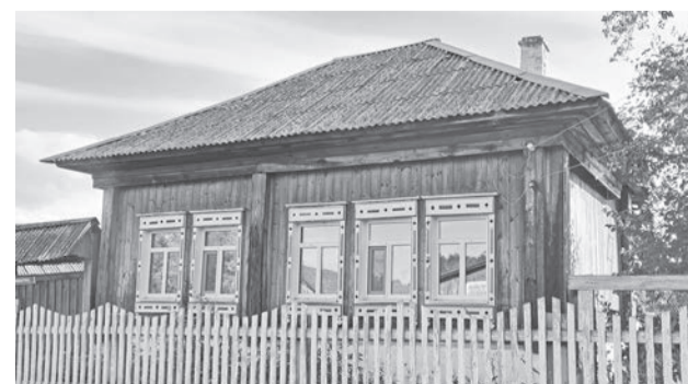
Улица Мамарина, 1.