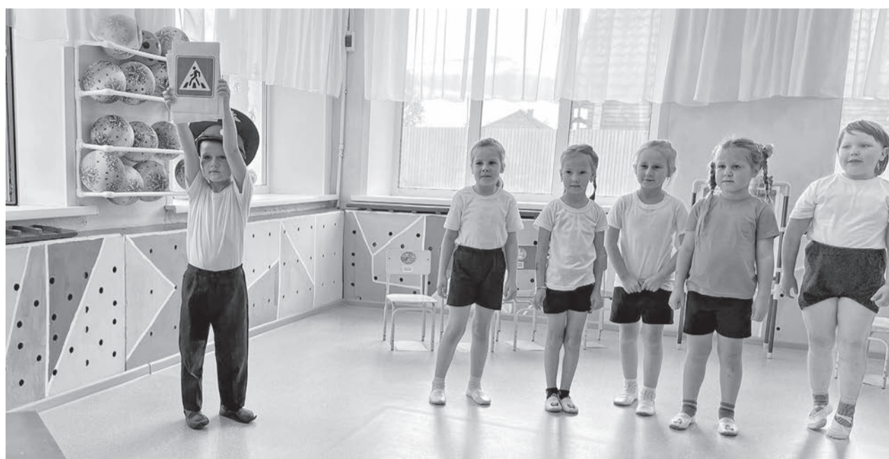
Выступление детей в Вязовском детском саду.