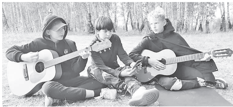
Незабываемые выходные на природе.

пойти в поход и прочесть стихи о человечности, которые мы с радостью нашли в различных источниках и выучили.