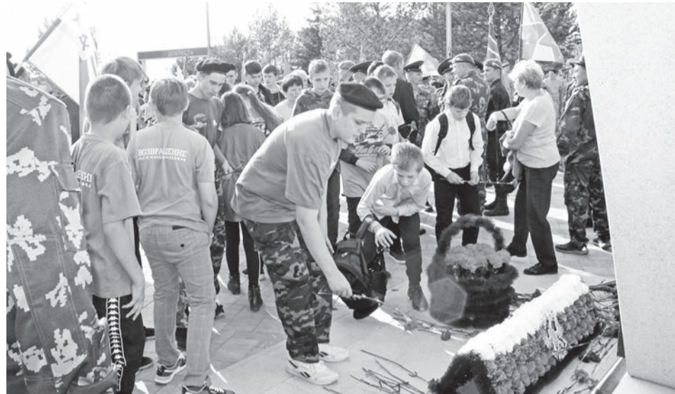
Поисковики возложили цветы к памятнику пограничникам.

– открытие памятного знака «Матерям и вдовам защитников Отечества». Поисковики не могли обойти своим вниманием и памятник пограничникам Великой Отечественной войны 1941-1945 гг. К постаментам возложили цветы.