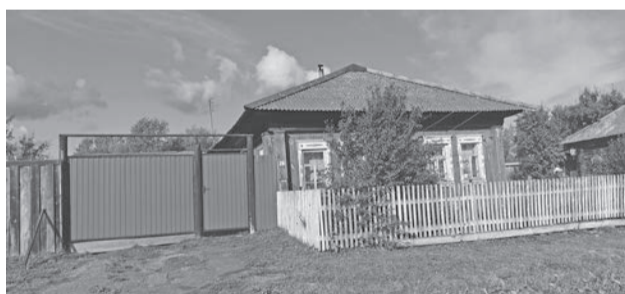
Улица Мамарина, 28.